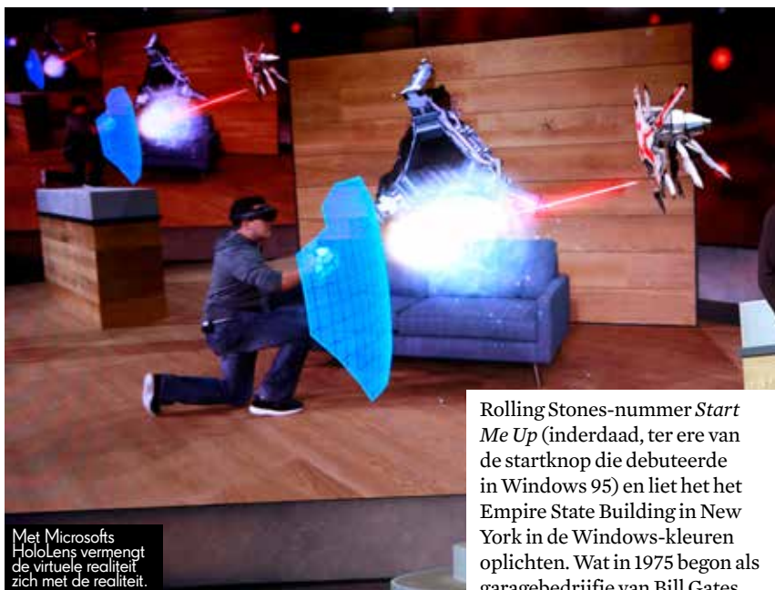
Met Microsofts HoloLens vermengt de virtuele realiteit zich met de realiteit.

Hoe Microsoft na een lange periode van verval zijn cool weer hervonden heeft. Echt waar, Esquire's Rens Lieman zag het met eigen ogen.